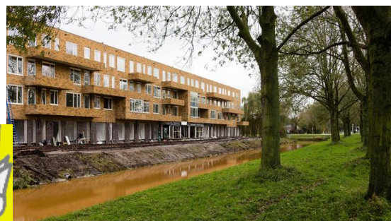
De Meentehof Steenwijk